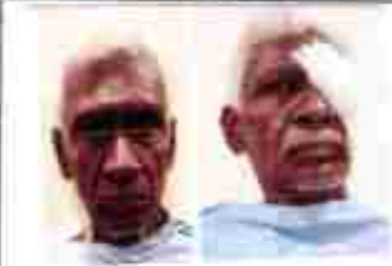
Pre op post op 2845 - Belarendran

PERMANENT RESIDENCE ADDRESS : स्थायी आवासीय पता